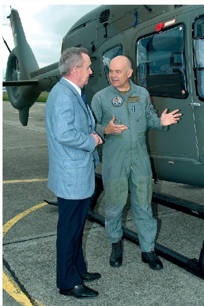
Präsentation des neuen Armeehelikopters EC-635.

forderungen stellen, die weder im täglichen Betrieb noch im FDT realistisch trainiert werden können. Ich bin sehr dankbar, dass ich mit der Planung und Durchführung solcher Einsätze meine wichtigsten persönlichen Erfahrungen machen durfte. In Anlehnung an die Aussagen im Sipol B 2010 werde ich mich stark dafür einsetzen, dass die Luftwaffe die von der Politik geforderten High Value Assets in Form von Helikoptern und Spezialisten bereit hält. Mehr ist auch in absehbarer Zukunft nicht möglich, da eine Milizarmee nur Fähigkeiten in langdauernde Missionen einbringen kann, über die sie auch im täglichen Betrieb (d.h. mit der Berufsorganisation) in genügendem Masse verfügt.