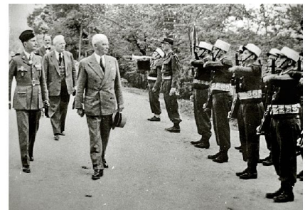
General Guisan schreitet im Jahre 1951 in Sétif (Algerien) eine Ehrenformation der Fremdenlegion ab.

Schweizer Legionären gab der General Guisan folgenden Rat: «Erfülle deine vertraglich vereinbarte Dienstpflicht und melde dich bei deiner Rückkehr den Schweizer Behörden.»