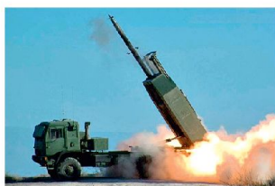
Mehrfachraketenwerfer «HIMARS» in Afghanistan.

auch GPS-gelenkte Minenwerfergranaten 120 mm zum Einsatz gelangen. Leichte Mehrfachraketenwerfer vom Typ «HIMARS» mit sechs Abschussrohren werden seit einiger Zeit in Afghanistan eingesetzt. Sie ermöglichen die frühzeitige Bekämpfung feindlicher Ziele bis maximal 70 km, wobei leistungsfähige Aufklärungs- und Feuerleitmittel notwendig sind. Bei Operationen im urbanen Umfeld werden die Systeme «HIMARS» gegen unterschiedliche Ziele eingesetzt, wobei damit auch vermehrt erkannte Sprengfallen über grössere Distanzen bekämpft werden sollen. Aber