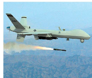
Zahl der bewaffneten UAV's wird weiter zunehmen.

2020 zurückgehen. Diese Bestandesreduktion soll durch die laufende Zuführung von Jagdflugzeugen der fünften Generation (u. a. F-35) aufgefangen werden. Bis 2020 sollen etwa 1000 Maschinen