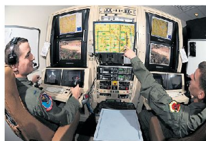
Führung und Einsatzplanung von UAV's benötigt viel Personal.

Tempo der Indienststellung neuer Drohnensysteme (UAV-Systeme) mithalten. Denn für die Führung und Einsatzplanung von ferngelenkten UAV's wird eine grosse Zahl von Piloten und Spezialisten benötigt. Die Air Force rief daher pensionierte Piloten auf, sich für die freiwillige Reaktivierung zu melden. In den letzten Monaten sollen sich gemäss Pentagon mehr als 1000 Offiziere a.D. gemeldet