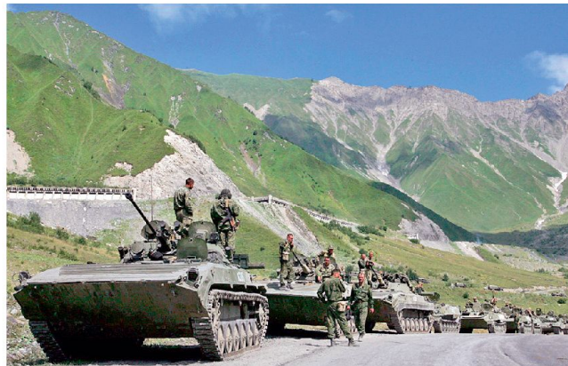
Vorstoss russischer Mot Schützen mit BMP-2.

Verwendung veralteter Artilleriegranaten und Bomben führte u. a. auch zu einer grossen Zahl von Blindgängern. Ein weiterer Schwachpunkt war bei den unzureichenden Aufklärungsmitteln zu erkennen und dies sowohl auf der operativen wie auf der taktischen Ebene: Die militärische Führung kritisierte dabei die geringe Auflösung der Satellitenaufklärung sowie die mangelnden Fähigkeiten der taktischen Aufklärungsmittel. Dazu soll