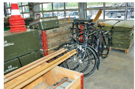
Die Erstfassung der Truppe basiert auf der stationären Logistik.

Der Projektbericht aus dem Pilotversuch in Othmarsingen liegt vor. Die Partner innerhalb der LBA sowie jene ausserhalb wurden für Stellungnahmen einbezo-