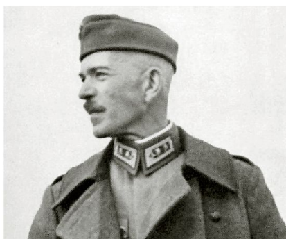
Der Mann für die schwierigsten Lagen: Generalleutnant Karl Lennart Oesch.

Nachdem Oesch noch ein Jahr als Generalstabschef gedient hatte, nahm er seinen Abschied im September 1945. Die Sowjets verlangten nun seine Verhaftung als Kriegsverbrecher. Oesch stellte sich und wurde für den Tod von 17 gefangenen Sowjets verantwortlich gemacht. Die Einzelheiten des «Tathergangs» sind nicht ge-