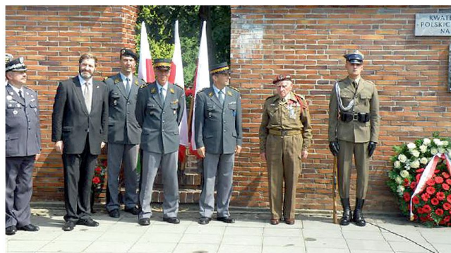
Die Schweizerdelegation im Militärfriedhof in Warschau.

en-, Ausbildungs- und Berufsschullager eingerichtet und die Soldaten für die Heimkehr nach Kriegsende vorbereitet. Nahezu 900 Soldaten haben in den Hochschullagern studiert, über 300 von ihnen erwarben ein Hochschuldiplom und über 60 ein Doktorat.