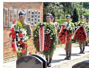
Die Ehrenwache der polnischen Armee bei der Kranzniederlegung in Warschau.

Huttwil erinnert an die Begegnung von General Prugar-Ketling mit unserem Oberbefehlshaber. General Guisan zeigte grosses Verständnis für die schwierige persönliche und berufliche Lage der Internierten. So wurden die Polen für den Strassenbau, die Landwirtschaft, für Entwässerungs- und Forstarbeiten eingesetzt, und sie leisteten dadurch einen wertvollen Beitrag für unsere durch Militärdienst geschwächte Wirtschaft. Zudem wurden Studi-