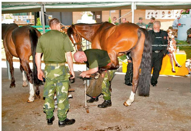
Schwedische Wettkämpfer der Livgardet.

Ausländische Wettkämpfer aus Deutschland, Frankreich, England und Schweden waren neben einem grossen Feld von Schweizer Wettkämpfern mit am Start. Die Teilnehmer konnten in den Disziplinen Schmieden und Beschlagen ihr Können unter Beweis stellen. Die militärischen Wettkämpfer wurden zusätzlich im Schiessen und im Reiten bewertet. Mit viel Einsatz kämpften die rund 40 Teilnehmer bei total 200 Starts um die besten Ränge. Die zahlreich erschienenen und begeisterten Besucher durften ein spannendes und abwechslungsreiches Turnier erleben.