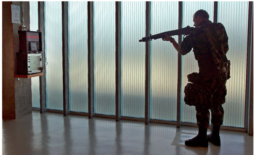
Ein Panzergrenadier justiert seine SIMUG Ausrüstung und Bewaffnung.

Obwohl das Werterhaltungsprogramm (LEO WE) für den Leopard 2 bereits begonnen hat, können wir noch keine aufgerüsteten Kampfpanzer fassen. Gemäss Instruktionen werden die modifizierten Panzer 87 Leo WE zuerst den Rekruten- und Kadernschulen übergeben. Wir werden zuerst in der Vierergliederung und dem neuen Ausbildungsverfahren geschult und dafür nächstes Jahr mit dem Panzer 87 Leo WE ausgestattet.