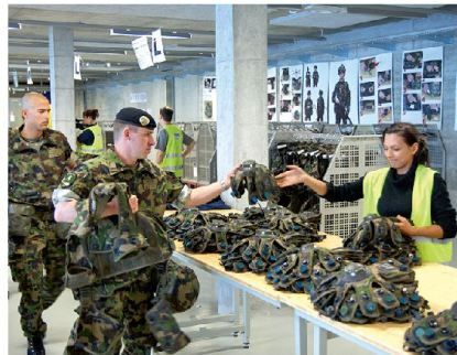
Übergabe der SIMUG PAB-Simulatoren (Persönliche Ausrüstung und Bewaffnung).

Neben der Interkompatibilität mit allen anderen Fahrzeugen kann mit dem LASSIM LEO eine sehr realitätsnahe Waffenwirkung erzielt werden. Distanz, Deckung und andere Umwelteinflüsse haben beispielsweise Einfluss auf den Treffereffekt des beschossenen Fahrzeugs, sei dies mit der 12 cm-Kanone, dem koaxialen Panzer-MG oder dem Kuppel-MG. Der Treffer-effekt kann in einem Ausfall der Turmbe-