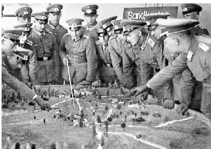
«Unteroffiziere der Reichswehr im Taktikunterricht 1932».

1. Auftragstaktik ist nicht der Regelfall. Dieser bestand aus straffer Führung, kurzen Befehlen und stetiger Kontrolle. Nur unter bestimmten Vorbedingungen kam das Prinzip der Auftragstaktik zum Tragen.