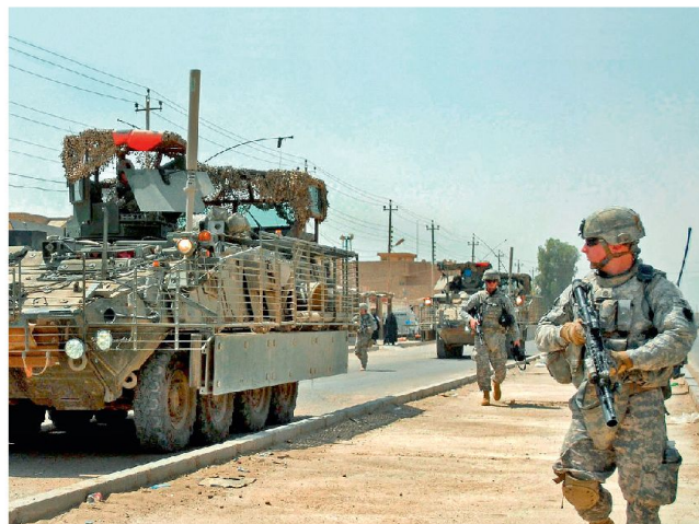
Der Schutz an Fahrzeugen (Spz. Stryker) wird laufend verbessert.

Die Erfahrungen der US-Truppen sind zu einem wesentlichen Teil auch für europäische Streitkräfte von Bedeutung. Auch diese sind heute daran, ihre mit konventionellen Mitteln ausgerüsteten Verbände vermehrt für