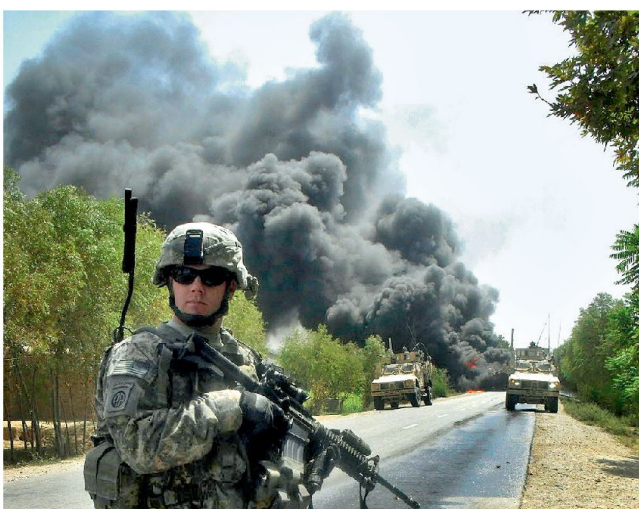
Sprengfallen sind heute die Hauptbedrohung für Bodentruppen.