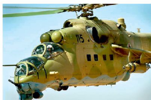
Afghanischer Kampf-helikopter Mi-35.

bewaffnet und ausgerüstet werden. Gegenwärtig ist diesbezüglich ein weiteres Rüstungsprogramm im Wert von rund