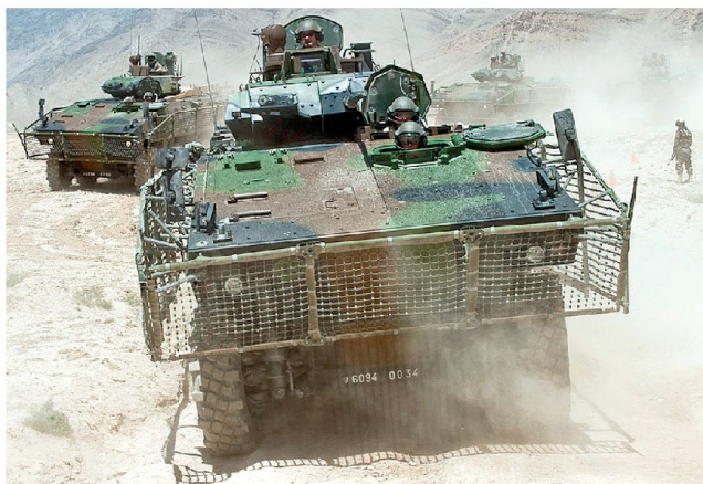
Einsatzbezogene Schutzmassnahmen beim VBCI (Slat Armour).

zeugen pro Monat an die l'Armée de Terre aus. Mit seiner 25-mm-Kanone bietet das 7,9 m lange und 28 Tonnen schwere Fahrzeug Platz für den geschützten Transport von elf Infanteristen einschliesslich Bewaffnung und Ausrüstung FELIN (neue Infanterieausrüstung). Die einzelnen VBCI dienen somit als Gruppenstützpunkt im Einsatz. Nach dem Kampfhelikopter «Tiger» und den Selbstfahrtartilleriegeschützen «Caesar» ist nun bereits das dritte neue Waffensystem den französischen Truppen im Kampfeinsatz übergeben worden. Vorausgegangen sind jeweils intensive Phasen der Zusammenarbeit zwischen Industrie, Truppe und DGA, damit wichtige Erkenntnisse, sofort umgesetzt werden konnten.