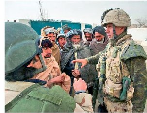
Stabilisierungseinsätze stellen hohe Anforderungen an die Soldaten.

rism-Operationen) wird heute in der US-Militärführung eine zentrale Bedeutung beigemessen. Dies wird unter-