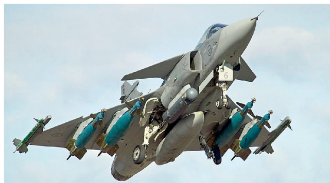
Moderne Bewaffnung beim schwedischen JAS-39C «Gripen».

dabei nicht um ein eigentliches Kampfwertsteigerungsprogramm, sondern um laufende Verbesserungen und Anpassungen an die neusten Einsatzbedürfnisse. Diese beinhalten u. a. die Integration neuer Software für Elektronik und Radarsysteme, Ergänzungen bei den Kommunikationsmitteln sowie eine Aufdatierung der elektronischen Gegenmassnahmen. Der Direktor von Saab weist im Weiteren darauf hin, dass bei der vorgesehenen Modernisierung nur die schwedischen Bedürfnisse berücksichtigt werden und dass es sich hier um ein rein schwedisches