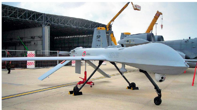
Die italienische Luftwaffe verfügt bereits über UAV-Systeme «Predator».

der Zwischenzeit verhandelt auch Frankreich mit den USA über den Kauf von Drohnen des Typs MQ-1 «Predator». Die französischen Streitkräfte haben zwar bereits Drohnensysteme in Afghanistan stationiert, benötigen aber gemäss eigenen Angaben wesentlich mehr. Die erkennbare Verschlechterung der Sicherheitslage und der Kampf gegen die Aufständischen in Afghanistan hat zur Folge, dass eine