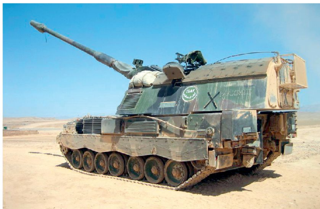
Panzerhaubitze 2000 bei den deutschen Truppen in Afghanistan.

«Fennek» basieren. Seit Mitte Jahr ist dieser Systemverbund einsatzbereit und hat im Zusammenwirken mit den Gefechtsständen der Truppenkontingente in Mazar-e Sharif und Kunduz nebst Übungsschiessen auch bereits erste Ernstesätze durchgeführt. Für die eingesetzten Kräfte wird seitdem die Feuerunterstützung im Umkreis von bis zu 30 Kilometern um das Feldlager Kunduz sichergestellt. Im Verlaufe der ersten Gefechtseinsätze bewährte sich der Systemverbund «ADLER» und sorgte gemäss den verantwortlichen Truppenkommandanten für eine schnelle, si-