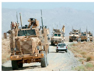
Überwachungsaufgaben mit geschützten MRAP-Fahrzeugen.

Der Überlebensfähigkeit und damit dem Schutz der eingesetzten Soldaten wird heute höchste Bedeutung beigemessen. Die schmerzhaften Erfahrungen in den ersten zwei Jahren nach dem Einmarsch im Irak haben ein Umdenken in der militärischen Führung bewirkt. In der Folge sind in den letzten Jahren die Schutzausrüstungen für Soldaten laufend verbessert und den Einheiten tausende von neuen geschützten MRAP-Fahrzeugen (Mine Resistant Ambush Protected) zugeführt worden. Zudem wurden bei den bereits vorhandenen Fahrzeugtypen (Humvee, Stryker usw.) mit grossem Aufwand Schutzver-