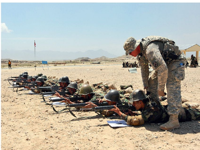
Ausbildung von Soldaten der afghanischen Armee.

Stabilisierungsoperationen und friedensunterstützende Einsätze sind personalintensiv und erfordern vor allem entsprechend ausgerüstete und ausgebildete Bodentruppen. Dies gilt umso mehr, wenn lokale Sicherheitskräfte fehlen und diese noch ausgebildet werden müssen. In diesem Zusammenhang wird denn auch die Anzahl von Spezialisten für die Ausbildung fremder Truppen weiter erhöht und bei den Soldaten die Kenntnisse der Sprache, der Kultur und der regionalen Besonderheiten in den Einsatzgebieten verbessert. Wie die Einsätze im Irak und in Afghanistan gezeigt haben, sind die Anforderungen an die einzelnen Soldaten wesentlich anspruchsvoller geworden. Sie müssen in der Lage sein, in einem meist fremden Umfeld und einer schwer einschätzbaren Bedrohungslage ihren Auftrag zu erfüllen. Ein Fehlverhalten gegenüber der Zivilbevölkerung kann unmittelbar schwerwiegende Konsequenzen haben. In diesem komplexen Umfeld müssen vermehrt auch Soldaten und Offiziere auf der untersten taktischen Stufe wichtige Entscheidungen treffen. Bei Stabilisierungseinsätzen und beim Kampf gegen einen militanten Widerstand, der zunehmend