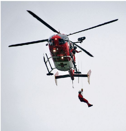
Windendemonstration durch die REGA.

AE gliedert sich in dringend (< 12h), prioritär (<24h) und Routine (<72h). Dies in einem 24 Stundenbetrieb. Bei der taktischen AE werden deutlich kürzere Zeiten gefordert (dringend: <2h, prioritär <4h, Routine <6h) [Tab 2]. Ziel ist das Erreichen einer Interoperabilität, Schaffung von Synergien und Kompatibilitäten zwischen verschiedenen Systemen, womit eine effektive Zusammenarbeit überhaupt ermöglicht werden kann. Dies begünstigt die Überlebensrate von Patienten, vermindert Fehlerquellen und setzt weitere Ressourcen frei.