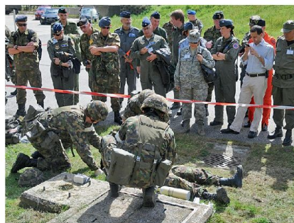
WS Teilnehmende einer Sanitätsdemonstration in Ambri.

Die Schweiz als Gastland hat den fünf-tägigen Workshop vom 13. bis 17. September 2010 in Dübendorf durchgeführt. Die Teilnehmer haben sich intensiv mittels Referaten, Diskussionen und Besichtigungen mit dem Thema Aeromedical Evacuation (AE) auseinandergesetzt. Die Darstellung von Ausbildungsprogrammen und der Erfahrungsaustausch aus realen Einsätzen (Haiti, Irak, Afghanistan) zeigten auf, dass die personellen und infrastrukturellen Voraussetzungen alleine für eine erfolgreiche Mission nicht ausreichen. Die richtigen Lehren aus den gemachten Erfahrungen sind ebenso entscheidend und führen zusammen mit der Kompetenz zu einer Optimierung der Leistungserbringung der hohen Anforderungen bei einer AE. Ein wichtiges