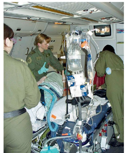
Medizinische Versorgung während eines Verlegungsflugs.