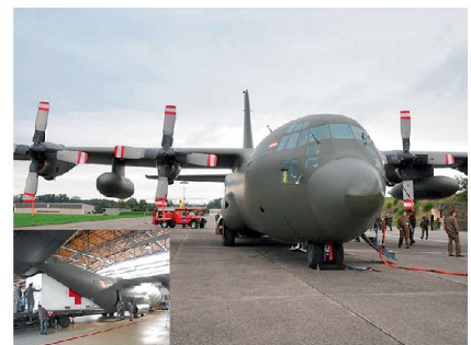
C-130 der österreichischen Luftwaffe in Dübendorf.

Der STANAG 3204 beschreibt die AE-Doktrin. Nach Definition ist die AE der