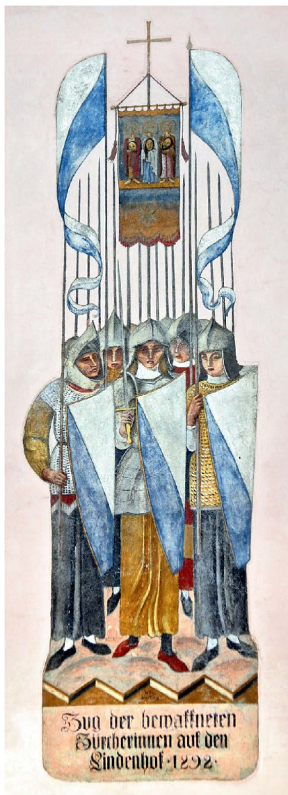
Nur ein Bluff oder reale Möglichkeit? Zug der bewaffneten Zürcherinnen auf den Lindenhof im Jahr 1292.

Diese Erwägungen sind in mehrerer Hinsicht nicht ganz zutreffend: Zwar ist es richtig, dass die Vertragsstaaten über die Organisation der Armee bestimmen können, das heisst über die allgemeine Wehrpflicht und das Milizsystem. Nicht der Disposition der Vertragsstaaten unterliegt aber die Gleichbehandlung der Geschlechter, diese muss unabhängig von der Wahl der Wehrorganisation gewährleistet werden. Ebenso unzutreffend ist die Annahme, in der Schweiz sei eine Wehrpflicht für Frauen nie in Erwägung gezogen worden. Die Einführung von militärischen und zivilen Dienstpflichten für Frauen wurde in der Schweiz seit Anfang des 20. Jahrhunderts wiederholt thema-