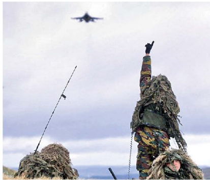
Forward Air Controller im Einsatz.

Für die Verbindung zur Luftwaffe sind auf der oberen taktischen Stufe (Stab Gros- ser Vb) der Chef Flieger und der Chef Flab verantwortlich. An diesem Zweierteam hängt die Beratung und Bedürfnisabklärung zur Koordination und Unterstützung