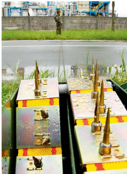
Nagelgurte im Einsatz.

Bei der Infanterie wird das Strassensperresortiment ebenfalls seit langer Zeit multi-