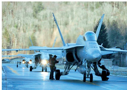
F/A-18 auf dem Taxiway.

Das System MALS setzt sich aus Primär- und Sekundär-Rundsuchradar, Präzisionsanflugradar sowie Flugfunkpeiler zusammen, welche durch den Generalunternehmer Cassidian (eine Unternehmung von EADS) integriert werden. Zu-