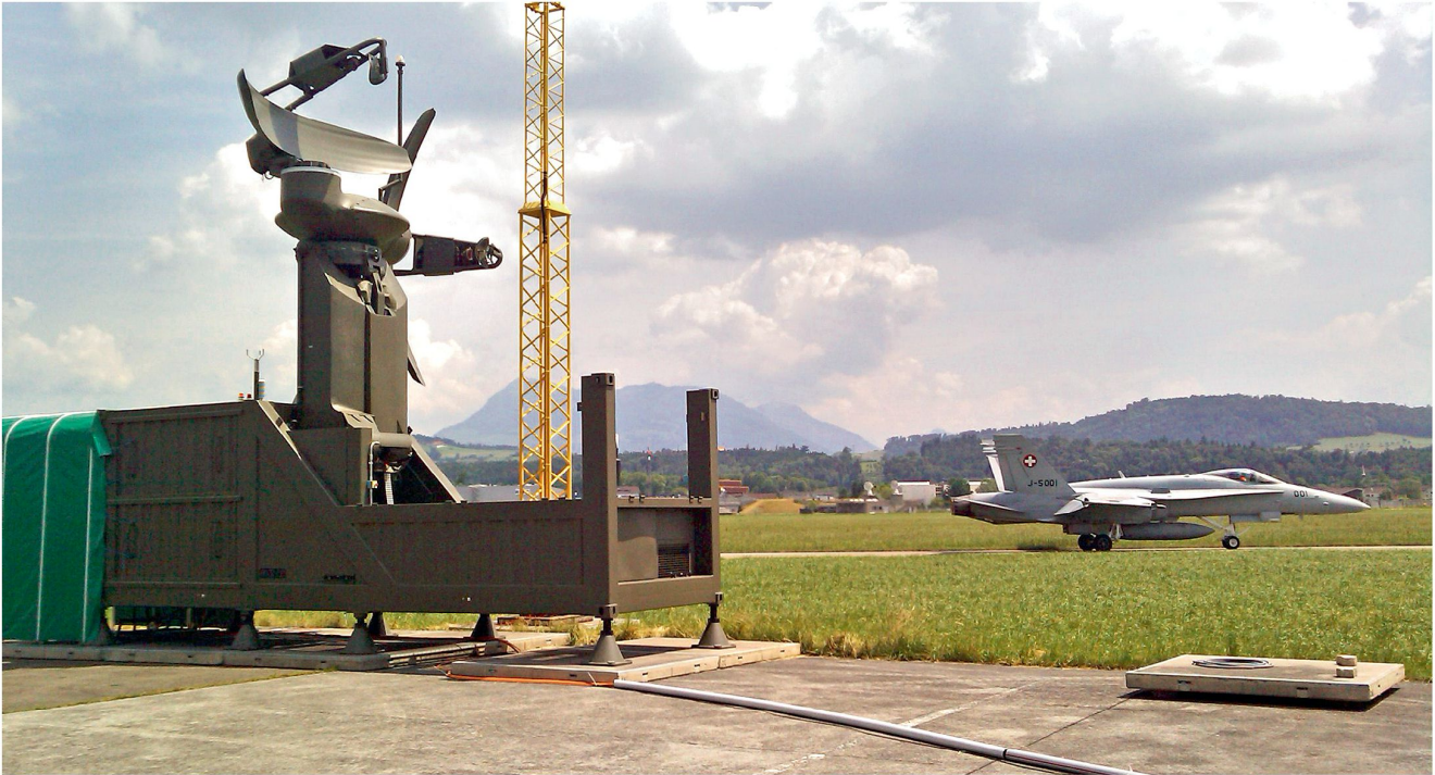
Rundsuchradarsystem (ASR), Primär- und Sekundär-Rundsuchradar (Evaluation)

ortet, identifiziert und meldet Luftfahrzeuge in niedrigen und mittleren Flughöhen und erstellt eine lokale Luftlage, die dem Flugverkehrsleiter im Kontrollturm zur Verfügung gestellt wird. Das Rundsuchradarsystem ergänzt das Luftlagebild von FLORAKO im Bereich der lokalen Flugplätze.