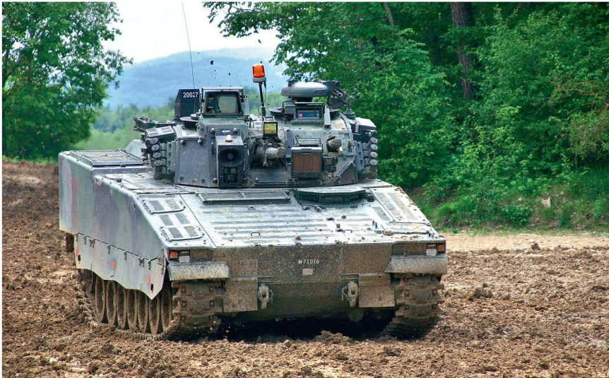
Schützenpanzer 2000 im Gefecht.

selbst mit Feuer und Bewegung vorgehen, kleinräumig eigene Aktionen führen (kurzzeitig selbständiges Fixieren und Flankieren eines schwachen Gegners) und verfügt nun über genügend Feuerkraft, eine gegnerische Panzerkompanie über kurze Zeit zu fixieren. Mit einer Besatzung mehr verfügt der Panzerzug über eine grössere Durchhaltefähigkeit auch für Aufgaben wie den Betrieb eines Checkpoints oder der Wache im Bereitschaftsraum.