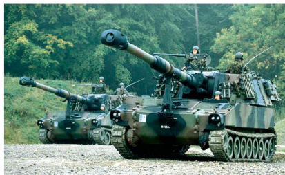
Das System Artillerie ist mehr als nur Geschütze – aber ohne Geschütze kann kein System Artillerie glaubwürdig betrieben werden.

Seit etwas mehr als hundert Jahren wird die Artillerie systematisch im indirekten Schiessen eingesetzt. Dies erfordert eine Aufklärungskomponente, die Ziele beurteilt und Feuerbefehle erteilt, eine Rechenkomponente, welche die Zielkoordinaten in Schiesselemente umrechnet und schliesslich auch Geschütze. Da stets mehr Ziele als Feereinheiten vorhanden sind, ist die Priorisierung der Ziele und die Zuweisung von Feereinheiten einer der wichtigsten artilleristischen Prozesse, der eng mit den Kommandanten der Kampftruppen geführt werden muss. Dafür werden die entsprechenden Telekommunikationsmittel und Verbindungen für Daten und Sprache benötigt. Und nicht zuletzt kommt der Logistik beim Grossverbrau-