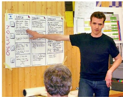
Präsentation der Lagebeurteilung.

Das Zielpublikum dieser Kurse am Kdo MIKA sind Führungspersonen des mittleren Managements Schweizerischer KMU, welche keine militärische Führungsausbildung genossen haben. Diese erlernen die systematische Anwendung der Führungstätigkeiten anhand ziviler Beispiele; ein besonderes Schwergewicht wird dabei auf den korrekten Prozess sowie auf die Analysetechnik «Aussage – Erkenntnis – Konsequenz» gelegt. Die Schulung erfolgt methodisch nach dem bewährten Konzept «Anlernen – Festigen – Anwenden». Wir verfolgen damit das Ziel, dass der Mehrwert der von uns geschulten Problemlösestrategien erkannt wird und die Teilnehmer in ihrem zivilen