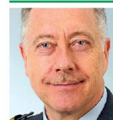
Korpskommandant André Blattmann Chef der Armee 3003 Bern