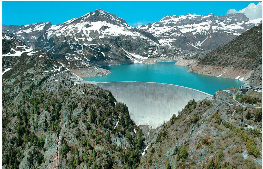
Welche strategische Bedeutung werden die Schweizer Pumpspeicherkraftwerke künftig im europäischen Rahmen haben?

Diese Strategie, auf welcher die Ener-giepolitik der letzten Jahre ausgerichtet war, erfuhr am 25. Mai 2011 eine uner-wartete Neuausrichtung. Der Bundesrat hat unter dem Einfluss der Ereignisse von Fukushima und massivem Druck aus dem Parlament eine neue Energiepolitik for-muliert.