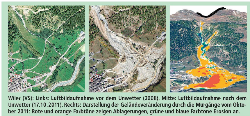
Wiler (VS): Links: Luftbildaufnahme vor dem Unwetter (2008). Mitte: Luftbildaufnahme nach dem Unwetter (17.10.2011). Rechts: Darstellung der Geländeänderung durch die Murgänge vom Oktober 2011: Rote und orange Farbtöne zeigen Ablagerungen, grüne und blaue Farbtöne Erosion an.

Bundesamt für Landestopografie swisstopo, 3084 Wabern, www.swisstopo.ch