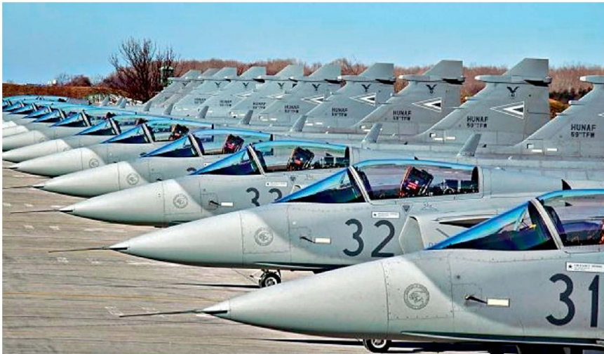
Staffel Gripen C der ungarischen Luftwaffe.

Üben dieser Abfang- und Identifikations-einsätze stellt eine der Kernaufgaben unserer Kampfpiloten dar. Für den Einsatz bei Tag und bei Nacht, bei jeder Wetterlage und in grossen Höhen, stehen heute 33 Flugzeuge F-18 «Hornet» zur Verfügung.