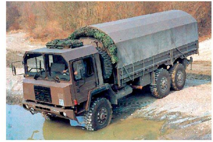
Ausserdienstliche Weiterbildung der Militärmotorfahrer.