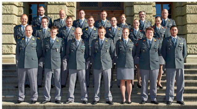
Die Absolventinnen und Absolventen.