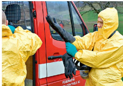
Feuerwehr rüstet sich mit ABC-Schutzanzügen aus.

Nicht nur Angriffe auf Maschinen oder Steuerungsanlagen über virtuelle Netzwerke, wie im Falle von Stuxnet geschehen, auch die direkte physische Schädigung oder Ausschaltung neuralgischer Kontrollmechanismen und Steuerungsfunktionen oder essentieller Bestandteile von Kritischen Infrastrukturen können eng getaktete Abläufe unterbrechen und damit unter Umständen ganze gesellschaftliche Bereiche lahmlegen. Moderne, hochgradig vernetzte Gesellschaften sind auf Grund ihrer häufig auf unmittelbare Abfolgen von Vorgängen abgestimmten Prozesse extrem anfällig für Unterbrechungen ihrer Informations- und Kommunikationsströme, aber auch ihrer eng aufeinander abgestimmten Waren- und Dienstleistungsströme und ihrer technologiegesteuerten Infrastruktur. Eingriffe in diese oft mit nur wenigen Reserven ausgelegten Bereiche können leicht zu erheblichen Einschnitten in den verschiedenen