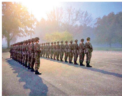
Abb. 1: Inspektion bei der Uem FU UOS 62.

Um die Ausbildung im Verbandsrahmen für die Grundausbildung optimal gewährleisten zu können, gehen die Re-