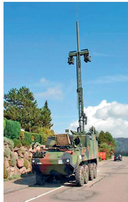
Abb. 4: Radio Access Point Panzer (RAP Pz).