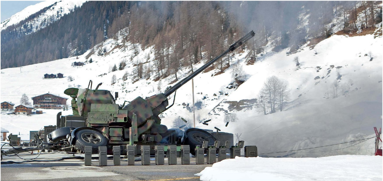
Fliegerabwehrkanone 35 mm 63/90 im scharfen Schuss.

(Pop-up-Ziele) oder bei Nichtverfügbarkeit der luftgestützten Mittel (keine Kampfflugzeuge auf Combat Air Patrol) in Frage. Sowohl die Permanenz als auch die Durchhaltefähigkeit sind Stärken der BODLUV, welche die luftgestützten Mittel ergänzen.