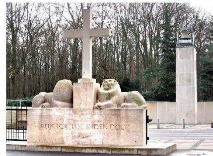
Das Denkmal auf dem Grebbeberg erinnert an den raschen Verlust der Freiheit 1940 und den langen Weg bis zur Rückeroberung.