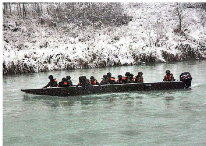
Übersetzaktion der Bausap Kp 23/4 auf der Rhône im Raum Villeneuve.

Der Kdt LVb G/Rttg will damit den Grossen Verbänden die maximale Unterstützung in den Bereichen Weiterausbildung der Kader, Verbandsausbildung, Ein-