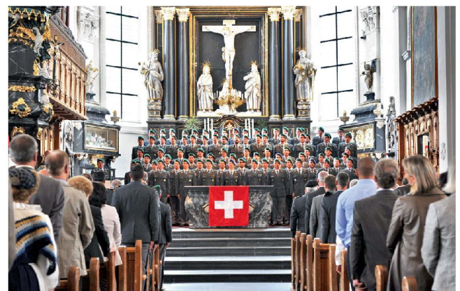
Inf OS 1-2/11: Feierliche Beförderung in der Pfarrkirche zu Stans.