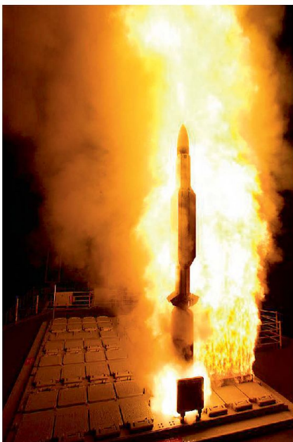
Der Raketenzerstörer USS Decatur (DDG 73) feuert eine SM-3 ab.

abdecken. Aufgrund der gegenwärtigen Lage im Nahen und Mittleren Osten ist aber von weit grösserer Bedeutung, dass BMD-Schiffe im östlichen Mittelmeer den israelischen Luftraum und Schiffe im Arabischen Meer den gesamten Persischen Golf (Golfstaaten und Iran) abzudecken vermögen. ■