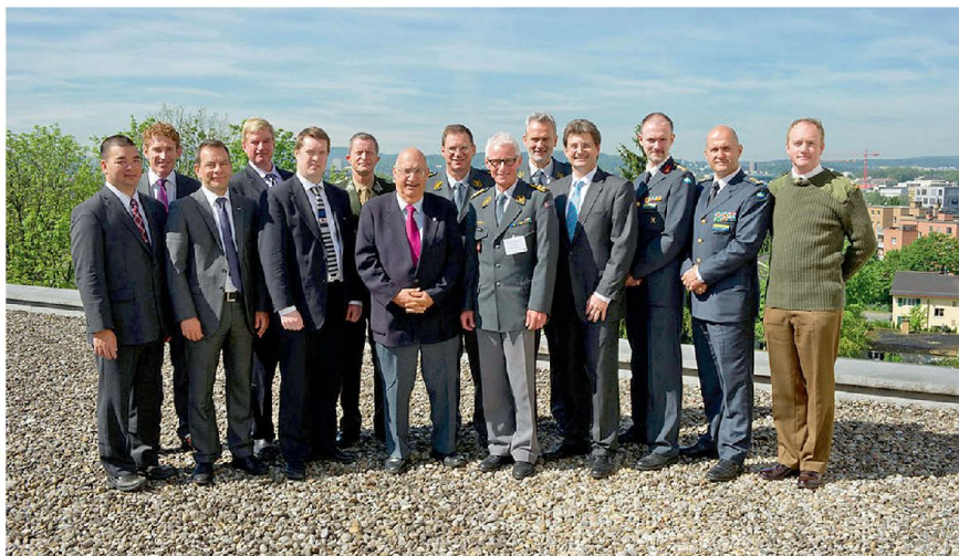
Referenten der Konferenz.

Die Bekämpfung ballistischer Raketen (Ballistic Missiles BM) kann nur im internationalen Verbund erfolgen. Die USA haben unter dem Namen NIMBLE TITAN ein Experiment (Wargame) gestartet, das die Interessen und Möglichkeiten von Staaten aufnimmt und gemeinsame Lösungen sucht. So sollen Sicherheitspolitik, Konzepte sowie Erfahrungen im Verbund festgelegt und konsolidiert werden. Aktuell sind regionale Experimente im Pazifik-Raum und in Europa sowie für die NATO erstellt worden. Die nächste