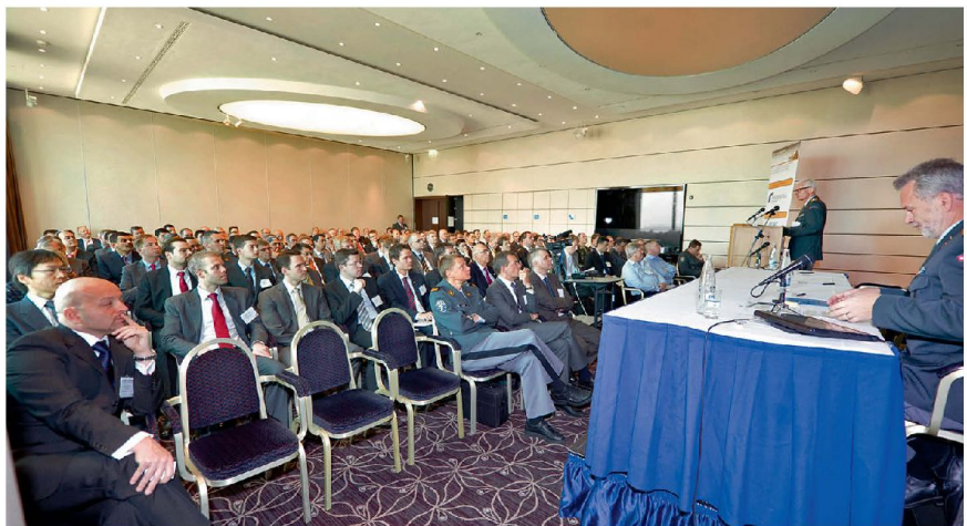
Eröffnung der Konferenz durch den Kommandanten der Luftwaffe KKdt Markus Gygax.

Bereits im Eröffnungsreferat des Kommandanten der Luftwaffe, der die Bedrohung aus dem globalen Umfeld hinunterbrach bis zu den Herausforderungen unterhalb der Kriegsschwelle, wurde klar, dass in den letzten Jahren ein Paradigmenwechsel stattgefunden hat: Wurde früher der Waffenträger bekämpft, geht es heute primär darum, die Angriffsgeschosse selbst zu treffen und ihre zerstörende Wirkung zu verhindern. Das Bedrohungsspektrum reicht von Raketen-, Artillerie-, Minenwerfer (RAM) Angriffen mit kleinster De-