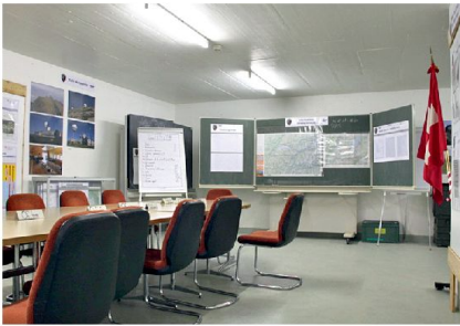
Rapportraum im KP militärische Führung.

Die ständige Verbesserung und Verstärkung des Dispositivs «AERO SUBITO» ist unser Hauptanliegen. Aus diesem Grund wird im Laufe des Oktobers 2012 wieder eine Übung stattfinden; sie beinhaltet hauptsächlich die Ablösung von