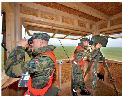
Auf einem Beobachtungsturm.

Die Republik und der Kanton Genf spielen in der Sicherheitsarchitektur der Schweiz eine herausragende und entscheidende Rolle. Sie sind das Nervenzentrum der Aussenpolitik und die Heimat für 31 internationale Organisationen, 242 diplomatische Missionen, 250 Nichtregierungsorganisationen (NGO) und für etwa 40 000 akkreditierte Diplomaten. Der Kanton ist Gastgeber für ungefähr 173 000 Frauen und Männer, die sich jährlich in Genf zu verschiedenen Konferenzen treffen. Diese für die Schweiz einmalige Situation erzeugt ein erhöhtes Sicherheitsbedürfnis. Die von den Vereinten Nationen (UNO) am 30. Juni 2012 durchgeführte Konferenz zur Lage in Syrien stellt ein aktuelles Beispiel dar. Derartige Treffen stellen zwar für unsere Partner in Genf das tägliche Brot dar, aber auch bei ihnen sind die Grenzen manchmal erreicht und sogar überschritten. In einem solchen Fall wird der Regierungsrat des Kantons Genf einen Antrag um