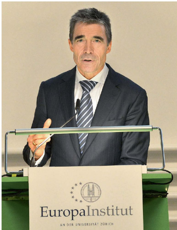
Der Generalsekretär der NATO, Anders Fogh Rasmussen, bei seinem Referat in Zürich am 22. November 2012.