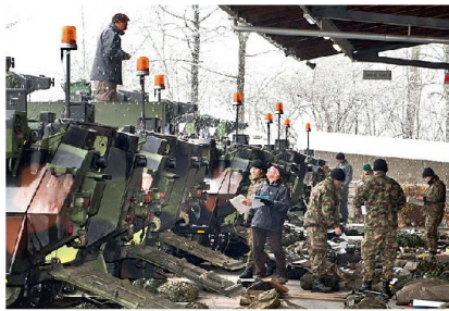
Material- und Fahrzeugfassung erfolgt mit WEA immer am selben Standort.

Neu erhält die Logistikbrigade 1 ein fünftes Logistikbataillon. Jedem Armeelogistikcenter wird mit der WEA ein Lo-