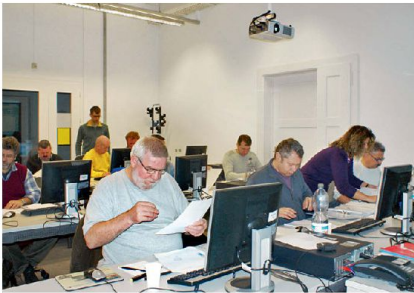
Oberes Bild: Schulung und Weiterbildung in der Anwendung von SAP.

standhaltung. Auch die infrastrukturellen Leistungen, wie die Wartung von technischen Anlagen und die Bereitstellung sowie der Unterhalt an Gebäuden, werden direkt vor Ort objektgenau elektronisch erfasst. Für die Zukunft werden die Schulung und das Training unserer Mitarbeiterinnen und Mitarbeiter in der Anwendung von SAP und die Durchsetzung der Datenqualität ein Dauerbrenner bleiben.