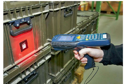
Etiketten mit Barcode sind eine Voraussetzung für durchgehende Logistikabläufe.

Das A und O der IT-gestützten Logistikprozesse ist die Qualität (Vollständigkeit und Aktualität) der verwendeten Daten. Der Materialfluss wird mit der mo-