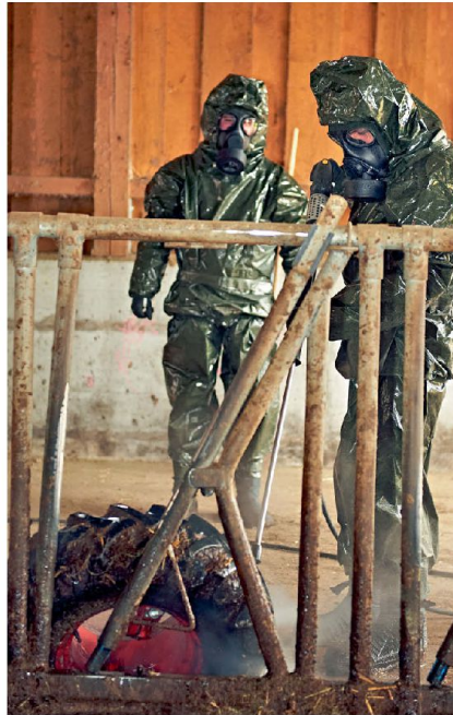
Seuchenbekämpfung: Veterinär-soldaten bei der Reinigung eines Schadensplatzes (Übungsszenario).

Die Vet Az OS inklusive praktischen Diensten ist eine für die Tierärztinnen und -ärzte massgeschneiderte Ausbildung, welche in dieser Form in der Schweizer Armee einzigartig ist. Im Rahmen dieser Offiziersschule werden Ausbildungen und Spezialisierungen ermöglicht, welche im Zivilen anerkannt und begehrt sind. Die angehenden Vet Az Of profitieren bereits während der sechzehn-wöchigen Vet Az OS von Schulungssequenzen mit Universitäts-Dozenten und zivilen Spezialisten