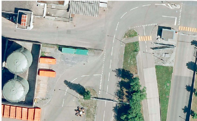
Ausschnitt CITIMAGE Thun

CITIMAGE bietet Anwendern von Geoinformation in den Bereichen Sicherheit, Blaulichtorganisation und Immobilienverwaltung die Möglichkeit, ohne eigenen Planungsaufwand auf hochgenaues und regelmässig aktualisiertes Bildmaterial zurückgreifen zu können.