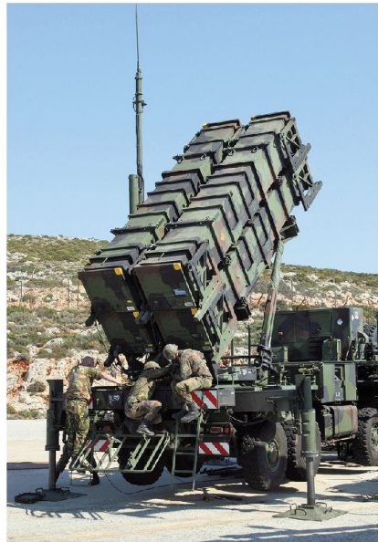
Bundeswehr hat zwei FeuerEinheiten «Patriot PAC-3» in die Türkei verlegt.

Die Neuausrichtung der europäischen Streitkräfte fordert von der Industrie ein hohes Mass an Anpassungsfähigkeit, Flexibilität und Innovations- wie Reaktionsvermögen. Im Gegenzug benötigt eine leistungsfähige Rüstungsindustrie als integraler Bestandteil staatlicher Souveränität aber auch gemeinsam tragbare Lö-