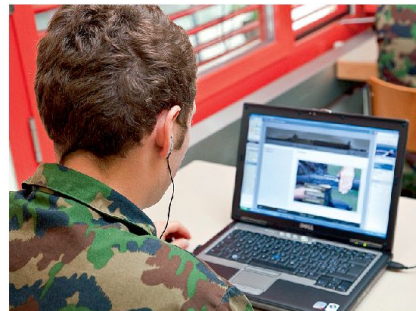
Soldat bei der Bearbeitung einer Lektion an einem E-Learning-Notebook.

Beim LMS VBS handelt es sich um eine komplette, vielseitige Plattform. Sie bietet nebst dem Online-Lernen eine Vielzahl von zusammenhängenden Lösungen an, z. B.: Präsenzkursverwaltung, Gestaltung komplexer Startbedingungen in Lehrplänen, Controlling der Ausbildung, Fähigkeitsverwaltung usw. An über 70 Standorten der Schweizer Armee befinden sich insgesamt 10 500 Clients (Notebook- und Desktop-Stationen). Das LMS VBS ist zudem ausserdienstlich vom Internet her erreichbar. Somit hat jeder AdA jederzeit, zeit- und ortsunabhängig Zugriff auf seine persönliche Lernumgebung. Und wo steht die Schweizer Armee damit international? Im