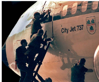
Befreiung der Geiseln durch die GSG 9 am 18. 10. 1977 in Mogadischu.

Ich halte eine engere Zusammenarbeit zwischen GSG 9 und KSK für absolut notwendig. Dies muss in einem entsprechenden Erlass, oder wie auch immer, festgelegt und geregelt werden. Es muss einiges politisch geändert werden. Die föderalistische Struktur der Bundesrepublik muss man so hinnehmen wie sie ist. Aber auf Bundesebene, da müssen wir einen Schritt vorwärts machen. Unsere Freunde sagen oft: Ihr Deutschen müsst pragmatischer werden. Zum Beispiel ist es bei den Fran-