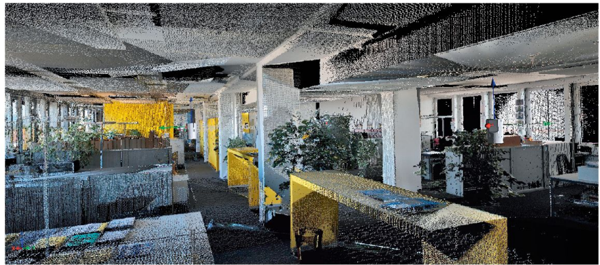
3D-Darstellung des Inneren des armasuisse-Gebäudes W+T in Thun, nachdem ein mit einem robotisierten LiDAR-Scanner ausgestatteter bodengestützter Roboter mehrere Millionen georeferenzierte Punkte vermessen hat (Geosat).

Der Zugang zur Information erfolgt über die Integration unterschiedlicher Technologien in ein modulares System. Das System wird allerdings nicht immer und unter jedweden Umständen die richtige Antwort liefern können. Insofern bedarf es klar definierter Planungsszenarien in Abhängigkeit der einsatzspezifischen Bedürfnisse und Anforderungen. Weitere Parameter, mit denen sich je nach taktischem Bedarf die richtigen Technologien auswählen lassen, sind die Existenz von 2D- oder 3D-