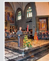
Promotion des GLG II/13