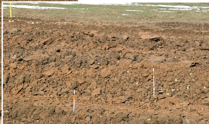
Die geöffnete Gasse wird mit dem Gassenmarkiersystem auf dem Fahrzeugheck gekennzeichnet.