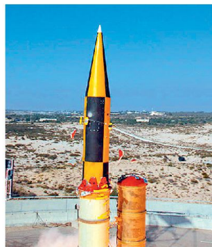
«Arrow 3» beim Verlassen der Abschussvorrichtung.

ist, soll nach ihrer Einführung die äusserste Schicht des geplanten mehrschichtigen, is-