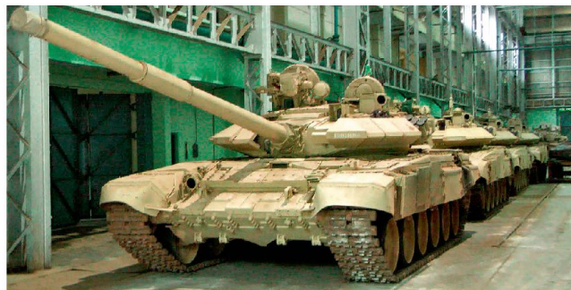
Zusammenbau von russischen Kampfpanzern T-90S in Indien.

Aircraft Corporation» (UAC) und der indischen «Hindustan Aeronautics Limited» (HAL) wurde im Oktober 2012 abgeschlossen. Ziel ist der Bau von 100 Transportmaschinen für Russland und von 45 für Indien. Zudem wird eine weitere Produktion für den internationalen Exportmarkt etwa in die neuen Schwellenländer angestrebt. Gemäss vorliegenden Planungen sollen etwa 2017 die ersten Prototypen fliegen und frühestens 2020 die ersten Serienflugzeuge ausgeliefert werden. Eine weitere militärische Kooperation der beiden Staaten zeichnet sich bei der Ausstattung des ersten indischen Flugzeugträgers ab.