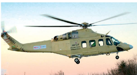
Lizenzproduktion westlicher Helikopter in Russland.

60 gebastelt, aber alle diese Projekte haben eines gemeinsam: Es mangelt ihnen an einem leistungsfähigen Triebwerk aus russischer Produktion. Bisher hat denn auch keines dieser Projekte die Serienproduktion erreicht.