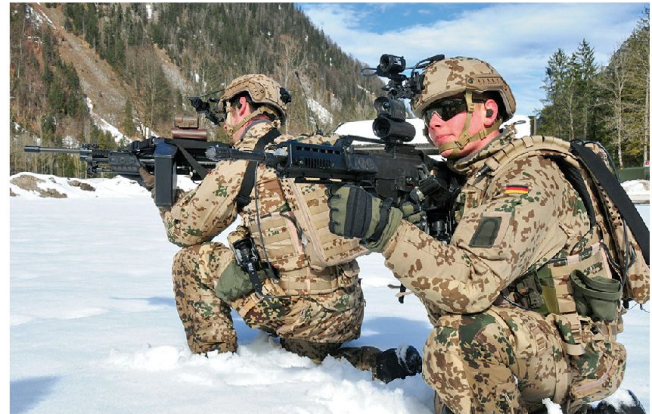
Kern- und Helmsystem sowie der elektronische Rücken sind Hauptkomponenten des Soldatensystems «Gladius».

stattung. Mit «Gladius» erhält die Bundeswehr eines der heute modernsten Soldatensysteme. Mit den verfügbaren Komponenten wird die zehn Mann starke Infanteriegruppe mit ihrem Fahrzeug in die vernetzte Operationsführung eingebunden. Dies ermöglicht den digitalen Austausch von Sprache und Daten mit der nächsthöheren Führungsebene und die direkte Anbindung an das Führungsinformationssystem des deutschen Heeres.