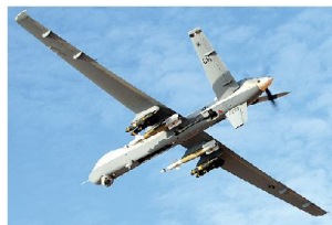
Mit technischen Massnahmen soll die Überlebensfähigkeit amerikanischer UAV-Systeme verbessert werden (Bild: MQ-9 «Reaper»).

fährdung im Einsatz zugenommen. Unbemannte Flugkörper werden von gegnerischen Gruppierungen und betroffenen Staaten zunehmend als lohnende Ziele angesehen und mit Luftabwehrwaffen aller Art bekämpft. Diese Erkenntnisse werden durch Zahlen aus dem amerikanischen Verteidigungsministerium bestätigt: Demnach haben die US-Streitkräfte seit 2010 etwa 40 Drohnen der Typen MQ-1 «Predator» und MQ-9 «Reaper» in den Einsatzräumen Irak und Afghanistan/Pakistan verloren. Unklar ist dabei, wie viele davon durch Unfälle, bzw. Abstürze verloren gegangen sind und welcher Anteil auf Verluste durch