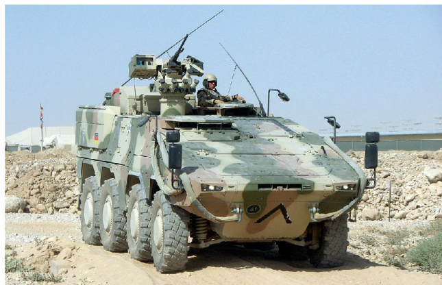
Vorführung des Transportpanzers «Boxer» an der Rüstungsausstellung IDEX.

Bereits im vergangenen Jahr konnte die deutsche Rüstungsindustrie ihre Exporte in die Staaten der Golfregion gegenüber dem Vorjahr mehr als verdoppeln. Der weitaus grösste Teil davon (rund 1,2 Mrd. Euro) entfiel dabei auf Saudi-Arabien (u. a. ABC Spürpanzer und Patrouillenboote), andererseits gingen die Ausfuhren nach den VAE (noch rund 125 Mio. Euro) und Bahrain zurück. Weiterhin hängt ist der Entscheid zur Lieferung von deutschen Kampfpanzern «Leopard 2» an die saudische Armee. Dafür wurde unterdessen ein Vertrag zur Lieferung von weiteren 30 ABC-Spürpanzern abgeschlossen. Neuerdings sollen Saudi Arabien und auch andere Armeen in der Region vor allem am Radschützenpanzer «Boxer» von Krauss-Maffei-Wegmann interessiert sein.