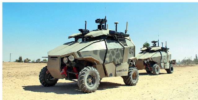
UGV «Guardium» für Überwachungsaufgaben im Gaza-Streifen.

Wenn mit den Robotern Unregelmässigkeiten und Gefahren entdeckt werden, können solche Aktivitäten mit einem gezielten Einsatz von Truppen verifiziert und gegebenenfalls mit Waffeneinsatz bereinigt werden. So können Kräfte gespart und auch die Gefährdung eigener Truppen minimiert werden. Die israelische Rüstungsindustrie ist seit Jahren mit der Entwicklung von UGV's beschäftigt. Vorgesehen ist deren Einsatz für vernetzte Aufklärungs- und Überwachungsaufgaben, zur Grenzsicherung oder auch zur Entminung und Zerstörung von IED's (Sprengfallen).