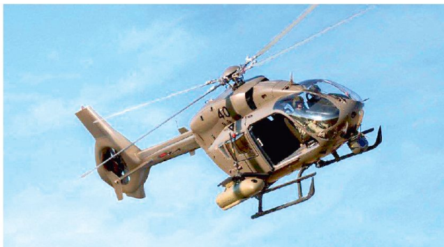
Mehrzweckhelikopter EC645T2 von Eurocopter für die deutschen Spezialtruppen?

Das deutsche Verteidigungsministerium will für die Truppen des Kommandos Spezialkräfte (KSK) 15 neue Mehrzweckhelikopter beschaffen. Das als dringend bezeichnete Beschaffungsvorhaben soll rasch abgewickelt werden; wenn möglich soll die Bestellung im Umfang von etwa 160 Mio. Euro noch vor den nächsten Bundestagswahlen vorgenommen werden. Die Dringlichkeit wird damit begründet, dass der Einsatz deutscher Spezialkräfte mit den seit den 70er Jahren im Einsatz stehenden veralteten Helikoptern Bo-105 nicht mehr in jedem