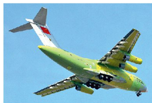
Erstflug des chinesischen Transportflugzeugs Y-20.

Die chinesische Lufttransportflotte verfügt heute vor allem über Transportmaschinen des Typs IL-76, die vor Jahren aus Russland geliefert wurden. Vor einiger Zeit wurden bei den russischen Flugzeugwerken in Taschkent weitere IL-76MD sowie IL-78 (Tankerversion) bestellt, die aber bis heute nicht ausgeliefert wurden. Nun scheint es, dass die chinesische Flugzeugindustrie unter Zeitdruck eine eigene Produktionslinie für Transportflugzeuge aufbauen will. Bis zur definitiven Aufnahme einer Serienproduktion der Y-20 dürfte es allerdings noch mindestens drei bis vier Jahre dauern.