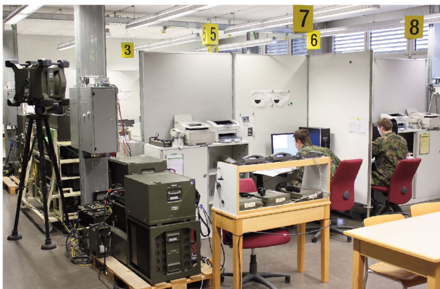
Intensive Ausbildung an anspruchsvollen Geräten.

So liegt neu das Schwergewicht in den ersten vier Wochen der VBA1 im Anlegen und Durchführen von Verbandstrainings und Übungen Stufe Gruppe und Zug. Damit der abverdienende Kp Kdt im praktischen Dienst die Stärken und Schwächen seiner Kp rasch erkennt, führt er in der ersten Woche eine Inspektion durch. So kann er die erkannten Ausbildungslü-