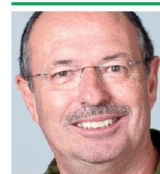
Brigadier Willy Siegenthaler Kdt LVb FU 30 VBS, Luftwaffe 6252 Dagmersellen

Noch wichtiger sind aber die Erkenntnis und der Grundsatz: Die Ausbildung im Lehrverband muss auch zukünftig streng und anforderungsreich sein – das erwarten unsere jungen Erwachsenen dieses Landes. Ebenso hat sich der Lehrverband den aktuellen gesellschaftlichen und politischen Rahmenbedingungen zu stellen. Dazu gehört die Bereitschaft, die Leistung des Lehrverbandes laufend zu analysieren und der Wille, daraus abgeleitete Massnahmen umzusetzen. Dies im Bestreben, stets das Optimum für unsere Miliz zu erreichen. Somit wird der Wandel auch in Zukunft steter Begleiter unseres Lehrverbandes Führungsunterstützung 30 bleiben. ■