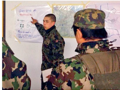
Befehlsgebung eines Zfhr.

Unteroffizierslehrgang zur Verfügung stehende Zeit führten zu Beginn des Praktikums zu einer Überlastung von Einheitsfeldweibel und Fourier. Der gezielte Einsatz der Zeitmilitär (z. B. Führung Material- und Munitionsmagazin) entlastete die Praktikanten und ermöglichte eine