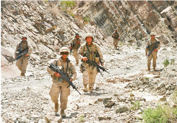
Vergeblicher Krieg: U.S. Marines in Afghanistan, 2005

wiewohl es freilich bequem wäre, diese Erledigung an andere (an wen?) zu delegieren und sich im «politischen Lehnstuhl» auf die Beobachterrolle zu beschränken. Nicht umsonst gibt es etwa in der NATO auch Mindesttrichtlinien für militärische Budgetansätze (Anm.: heimischen NATO-Befürwortern sei ins Stammbuch geschrie-