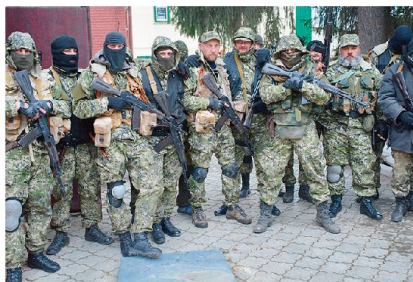
Prorussische Milizen in Slawjansk.

Krieg des Westens in Afghanistan oder die Rechtfertigung des Irak-Krieges (die sich letztlich als Betrug herausstellte) ein Grund dafür, über einen glatten Völkerrechtsbruch hinwegzusehen? Sind es die Enthüllungen des Edward Snowden, der pikanterweise in Moskau Asyl genießt, die