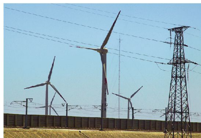
Fahrt von Urumqi nach Korla.

nisfrei erreichen. Mit dem Riesenprojekt manövriert China gleichzeitig auch die Seemacht USA aus, die gegenwärtig immer noch die Meerengen kontrolliert. Ebenfalls wollen die Chinesen das Umladen der Güter auf die russische Breitspur der transsibirischen Eisenbahnlinie einsparen. Langfristig wird deshalb auch Russland durch diese neue Linienführung geopolitisch ausmanövriert und könnte sehr bald ins Abseits geraten. Der Bau von riesigen Windenergieanlagen in seinem Westen wird China mit der Zeit auch von den Gaslieferungen aus Russland unab-