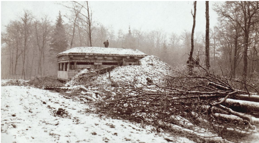
Le poste d'observation Nord, construit en 1915, reconstruit en 2012. Album Pierre Cardinaux, coll. H. de Weck