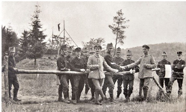
Au Largin, des soldats suisses posent avec des gradés allemands. Tout à droite un garde-frontière suisse.