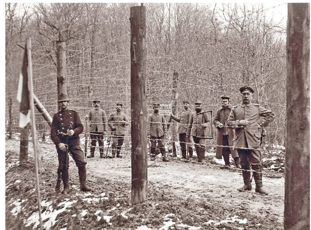
La barrière allemande à la frontière du Largin.

La Suisse, devenue un lieu de transit utile pour les deux camps, travaille au profit des belligérants. Leurs commandes stimulent l'exportation de produits utiles à l'effort de guerre, comme les composantes horlogères, les produits manufacturés, les denrées alimentaires, l'aluminium, le cuivre, le ciment. Dans le Jura Bernois et l'Arc Jurassien, on produit des composants de munitions très demandées par la France. En période de conflit, tout sert à l'effort de guerre, même le lait condensé, le chocolat et le tabac. Il n'y a pas