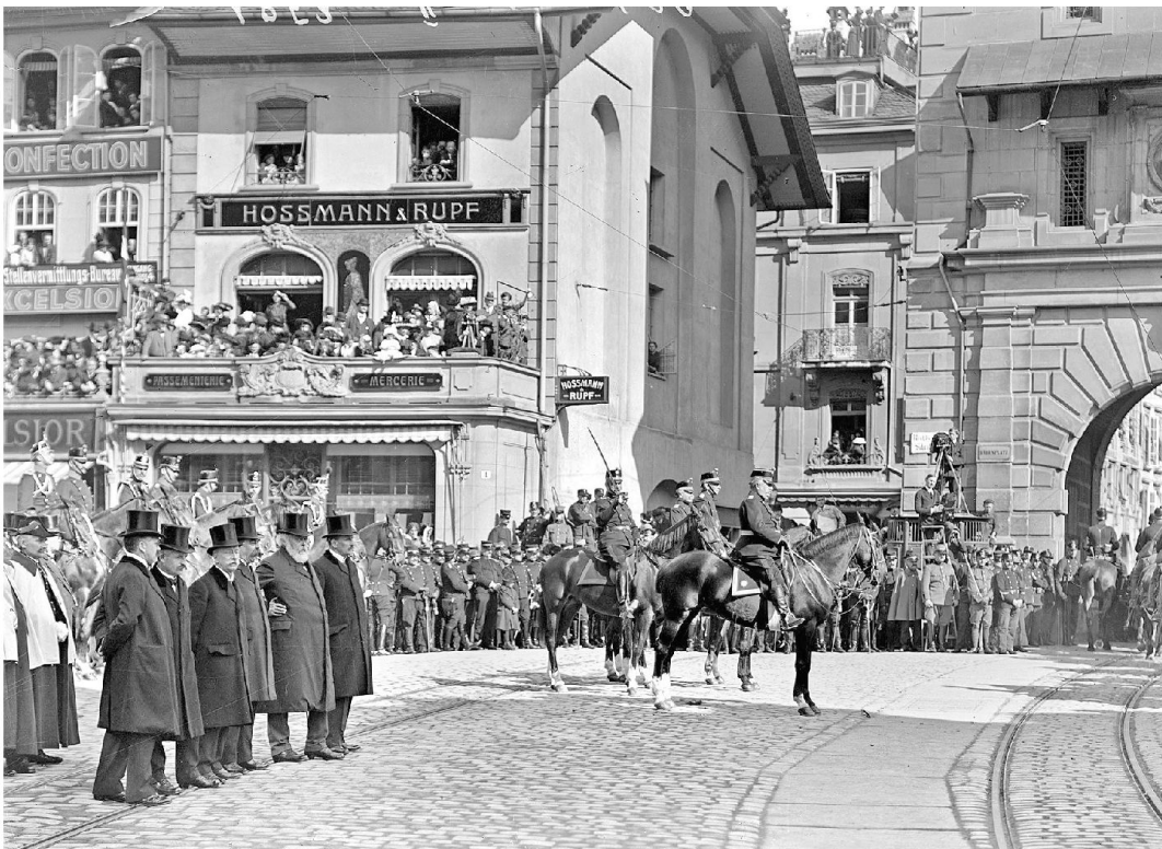
Bundesrat und General beim Defilee der 3. Division.

Über Wille schreibt der verantwortliche Redaktor: «Le général Wille est un homme d'action et de décision, d'une volonté de fer, d'une haute intelligence et dont les aptitudes à exercer le haut commandement dont l'Assemblée fédérale l'a chargé ne sont contestée par personne.» General Wille sei jetzt der Gene-