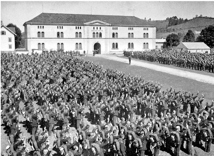
Mobilmachung und Verteidigung am 1. August 1914 vor dem Zeughaus Teufen.

Art» gewesen, fasst Walther das Geschehen zusammen. Zum Glück sei dieses unwürdige Schauspiel nicht an die Öffentlichkeit gedrungen.