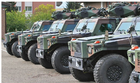
Eines der Hauptmittel der Aufklärungsbataillone: Das Aufklärungsfahrzeug EAGLE. In der Übung wurden auch die Panzerjäger 6×6 PIRANHA TOW als Sensoren eingesetzt.

Logistisch zeigte sich leider, dass die Beweglichkeit der Einheiten auch eine Frage der Küchenausstattung ist. Da we-