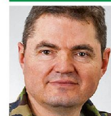
Brigadier Hans Schatzmann lic. iur. Kdt Infanteriebrigade 5 3380 Wangen an der Aare

Das Verhalten der Truppe wurde nach jeder Phase vor Ort besprochen und am Schluss in einer dezentralen Übungsbesprechung je Kompanie gewürdigt. Zur zentralen Übungsbesprechung trafen sich Kommandanten und Stäbe in Wangen a. A. Die Kader der beübten Bataillone schätzten diese seltene Trainingsform sehr. Insgesamt war diese Übung ein voller Erfolg – für die Truppe, für die Übungsleitung und für die Zusammenarbeit zwischen Bataillons- und Brigadestufe. Die Erkenntnisse aus der Übung bilden den Ausgangspunkt für die Stabs- und Volltruppenübung im nächsten WK. Den WK 2014 schlossen die beiden Bataillone würdig mit einer gemeinsamen Standartenabgabe auf der Chantier-Wiese in Solothurn ab. ■