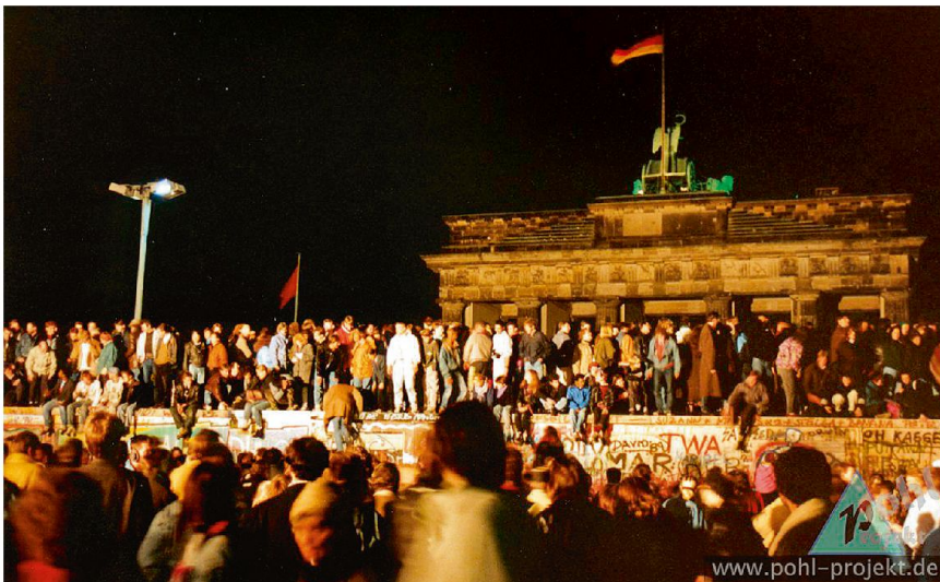
Der Friede ist ausgebrochen.