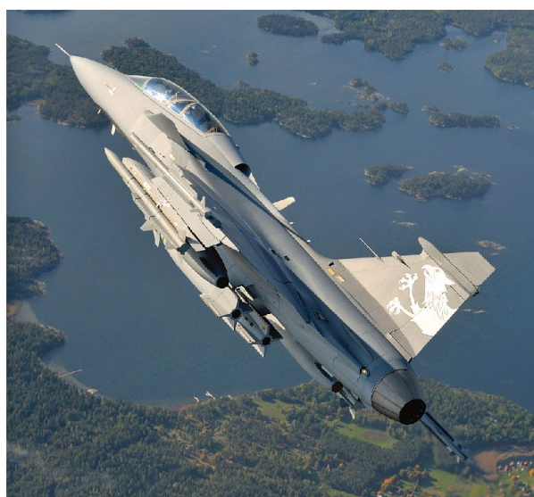
Wäre ein klares und glaubwürdiges politisches Zeichen des Willens zur Unabhängigkeit und zur Verteidigung.

keine Freunde, nur Interessen. Aber die Schweiz stiess doch meistens auf freundschaftliches Wohlwollen und manchmal sogar auf Bewunderung. Für die USA gibt es drei Kategorien von Staaten: Alliierte, Freunde, Feinde. Die Schweiz gehörte zur Kategorie der Freunde. Bei Bush Junior hiess es dann: «Entweder seid ihr für uns, oder dann seid ihr eben gegen uns.» Der Platz der Schweiz wurde damit weniger einfach definierbar. Es war für Schweizer Diplomaten auch in den guten alten Zeiten nicht immer alles ganz einfach. Verhandlungen waren nicht unbedingt stets leicht zu führen, Standpunkte konnten divergieren, es konnte durchaus zu kleineren Unannehmlichkeiten kom-